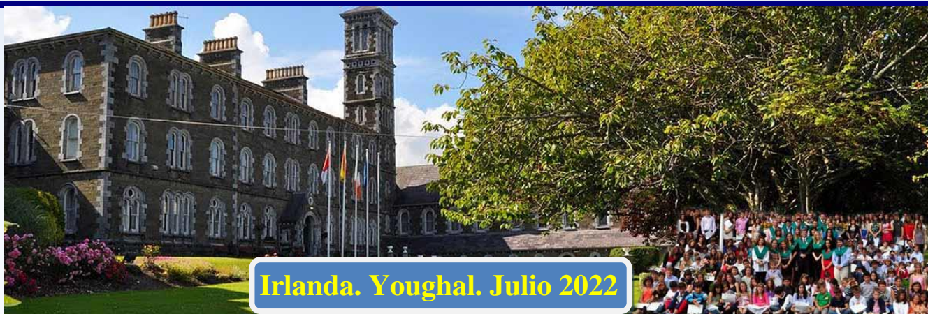
Irlanda. Youghal. Julio 2022

Residencia en Irlanda de carácter privado, asentada en una abadía totalmente restaurada y dotada de magníficas instalaciones deportivas y de interior. Dispone de grandes salones, salas múltiples, aulas, canchas deportivas y un entorno con grandes extensiones de jardines.